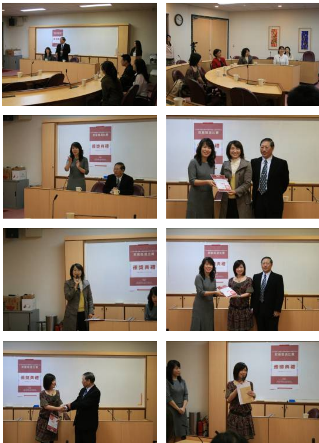
圖 3 教案比賽頒獎典禮照片