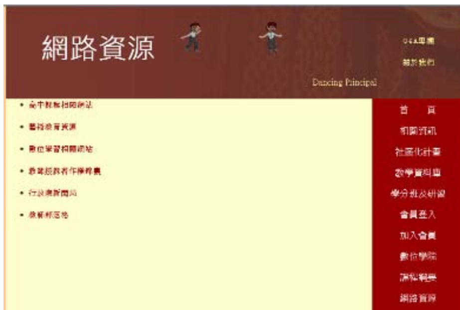
圖 7 學科中心網站網路資源

(四) 網路資源：於學科中心網站建立網路資源分享網頁，將政府機關及民間資源進行連結共享，提供教師參考。