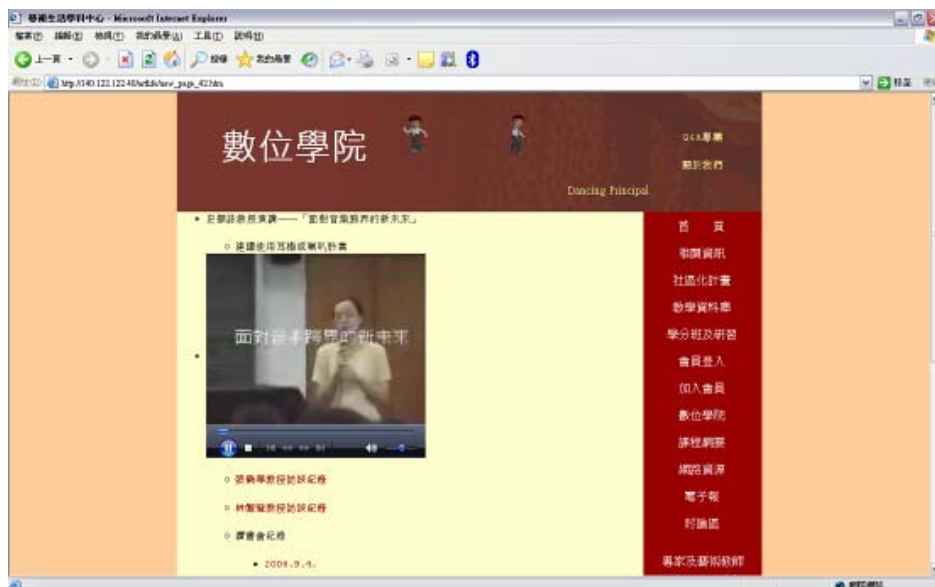
圖 6 數位學院

(三) 數位學院：配合相關研習或拜訪藝術名家，進行邀稿或採訪，並以錄音、錄影等方式進行資料之建立，此資料不僅有教育推廣之用途，亦同時作為藝術文化數位典藏之用。