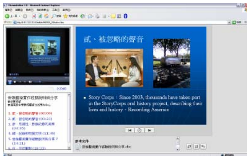
圖 5 網路自學教材