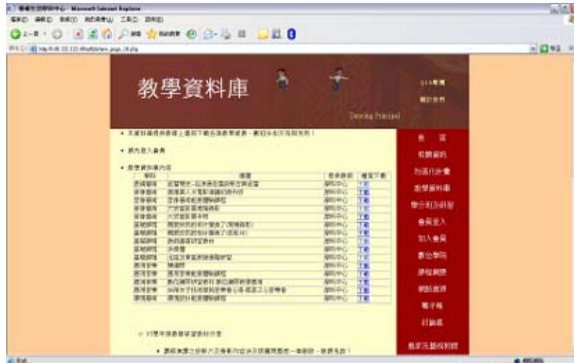
圖 4 教學資料庫