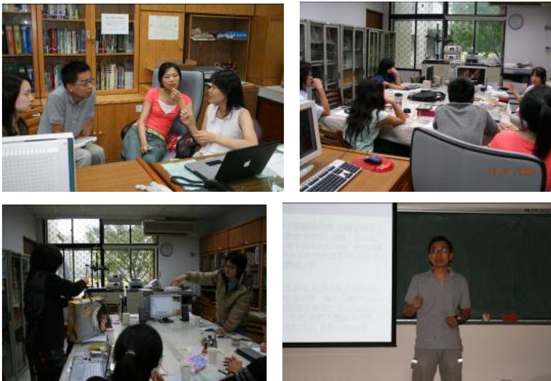
圖 2 音像藝術讀書會照片