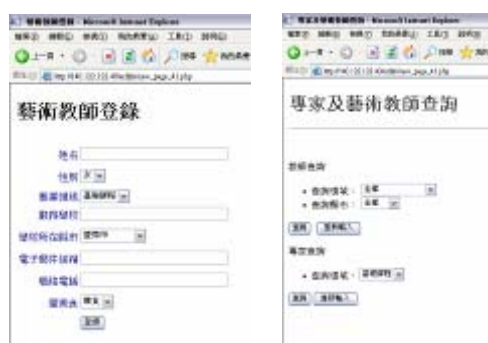
圖 9 專家及教師登錄與查詢

(三) 建置網路人才庫系統：建立全省各縣市藝術類科教師資料庫，於學科中心網站建置專家及教師登錄與查詢功能，登錄功能提供相關人才主動填報加入資料庫，查詢功能則提供網站會員查詢各類科專家學者名單，以及依任教科目及地區查詢教師之服務學校與電子信箱，增進教學交流之便利性。