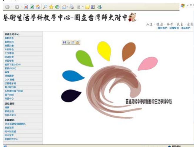
圖 2 學科中心網站首頁