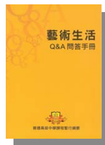
圖 3 Q&A 問答手冊封面