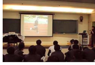
圖 5 應用音樂上課實況