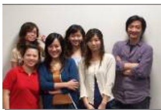
圖五 應用音樂教材研發團隊