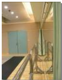
圖一 藝術生活學科教室

本中心於第一期計畫中建置中小型表演教室乙間(圖一),場地可提供30人次教師研習及學生課程。第一期計畫中已於本教室辦理教師研習(圖二)、表演藝術(舞蹈)實驗課程(圖三)及應用音樂實驗課程。本中心亦於95年9月及10月份於此辦理臺北市95學年度全市型社區化藝術生活學科學生營隊,營隊亦提供全國精英教師入場觀摩,並與教授進行教材研討會,課程包含應用音樂、音像藝術等,所建制之課程將提供全國教師上網下載。本中心期待於本期學科中心計畫中,完善不足之設備,進能有效的使用本教室辦理活動。