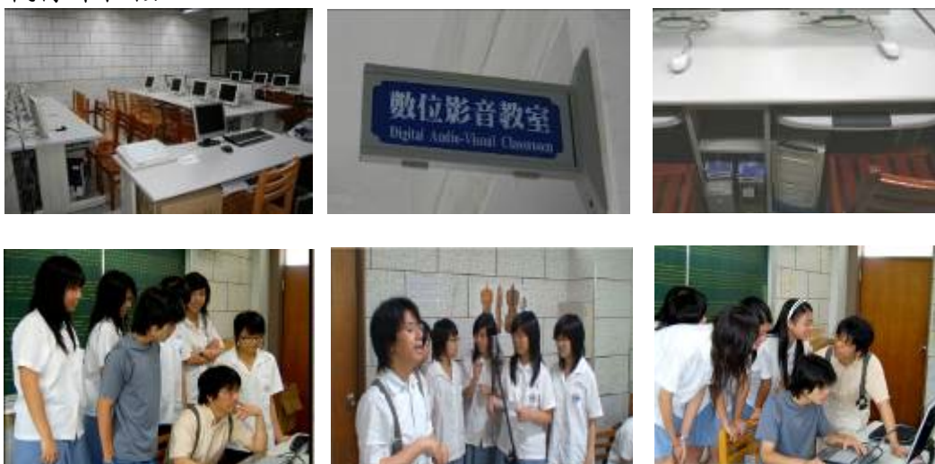
圖九 教室設備使用及課程

為完成應用音樂課程教室，中心特別挪用音樂班專業課程教室，架設電腦，將之改為數位影音教室。第二期經費中添購電腦桌、小鍵盤、投影機、廣播系統等，但由於經費補助不足，故多數電腦使用師大淘汰（使用超過5年以上）舊型電腦。在本學年度，教師仍使用硬體空間不足電腦授課，雖小有成果，但然無法執行課程核心。