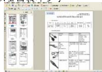
圖六 應用音樂教材資源