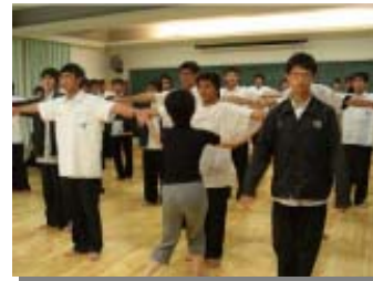
圖三 舞蹈實驗課程