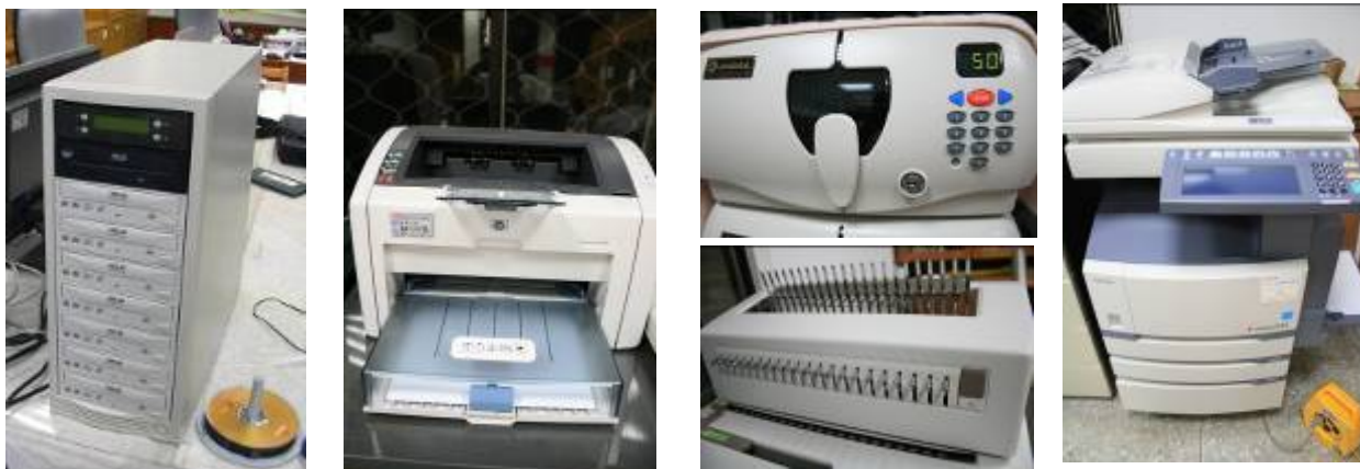
圖八 辦公室業務使用器材