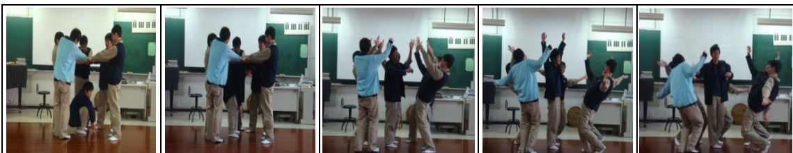
(圖2) 突破----以下為連拍(此集體雕塑屬動態)