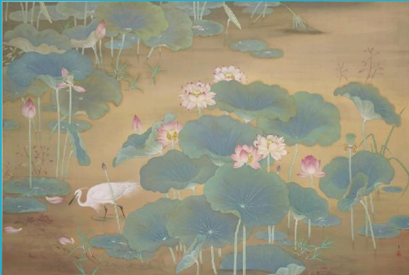
林玉山〈蓮池〉 膠彩畫