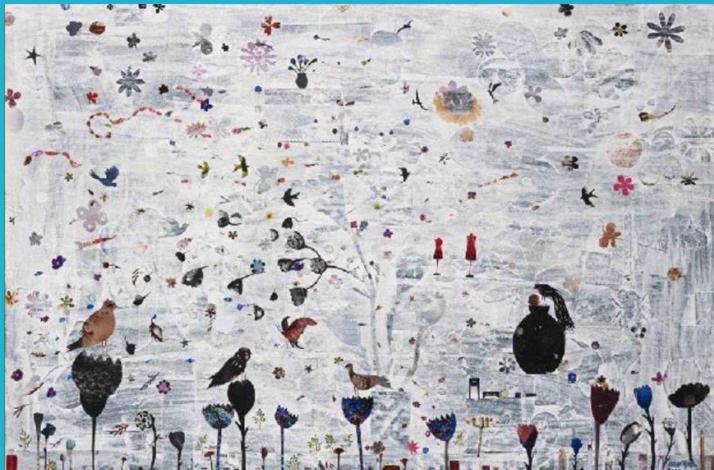
劉時棟〈花園〉 複合媒材