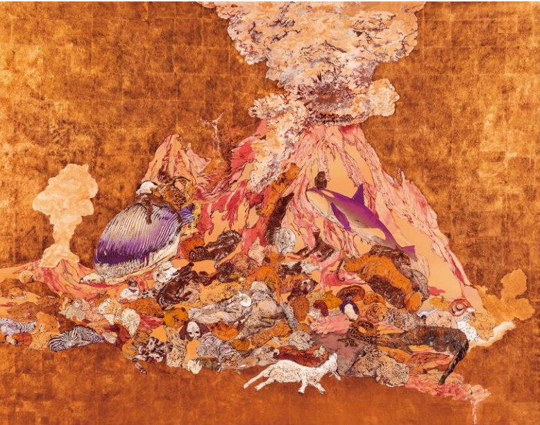
蕭珮宜 〈動物火山 I〉 複合媒材