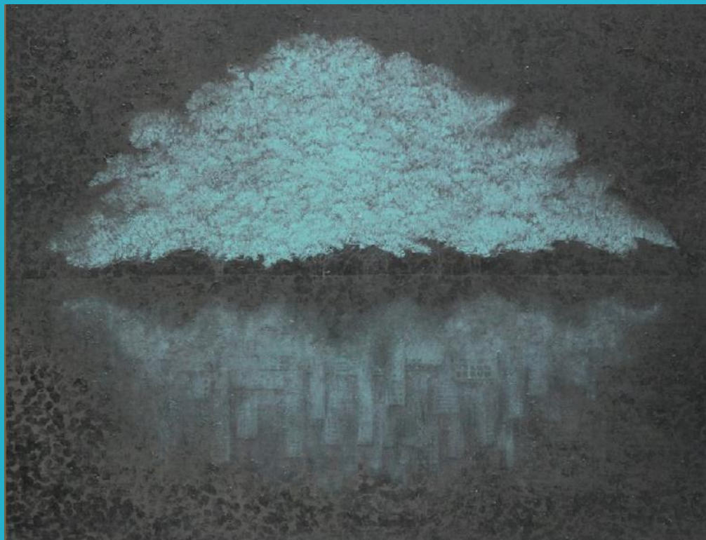
陳兆廷〈域·慾〉複合媒材