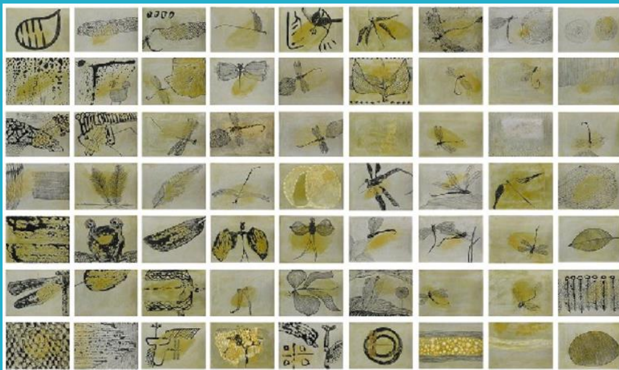
蔡獻友〈形象磁場No. 3〉複合媒材