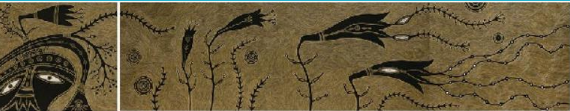
伊誕·巴瓦瓦隆〈如果有一天，大地的風不再吹了〉複合媒材