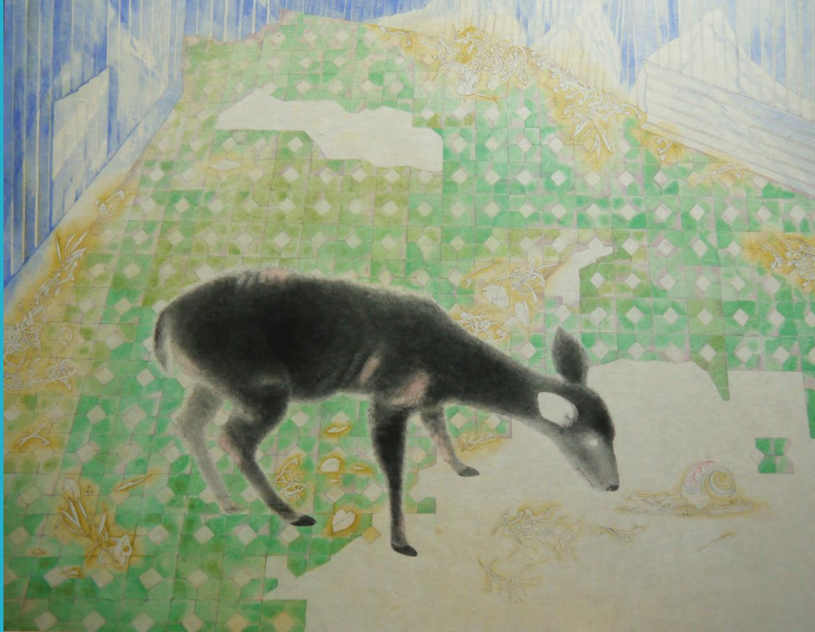
林郁珮〈漫遊地震帶〉水墨