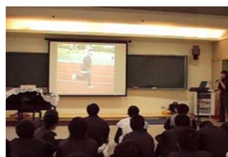
(應用音樂上課時況)